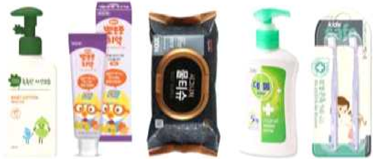
개인로션 1개 치약 1개 물티슈(100매) 5개 핸드워시 1개 칫솔(엄아) 2개